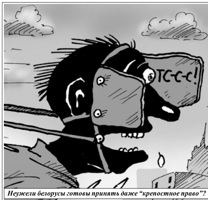
Неужели белорусы готовы принять даже “крепостное право”?

Несколько лучше обстояли дела лишь у тех помещиков, кто, не освобождая крестьян формально, все же начал внедрять более передовые методы хозяйствования, скажем, перевел крестьян с барщины на оброк. Эта